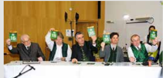
Fachjury Fotos: CP-Pictures-Graz

Freitag, 7. April 2017, 20:04–22:00 Uhr, Radio Stmk. „Unser Steirerland“